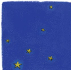
Constellation du Cygne