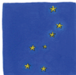
La Grande Ourse