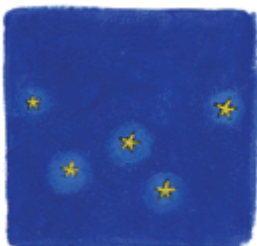
Constellation de Cassiopée

L'ensemble de plusieurs étoiles est appelé « constellation ». La nuit, dans le ciel, certaines semblent former des dessins. Chacune porte un nom différent.