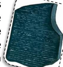
La pierre de Rosette