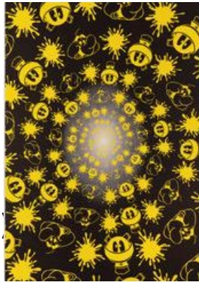
No Stain, No Gain (Black & Yellow Edition) (2018)