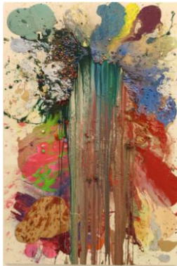
PRUNIER FLEURI (2018)