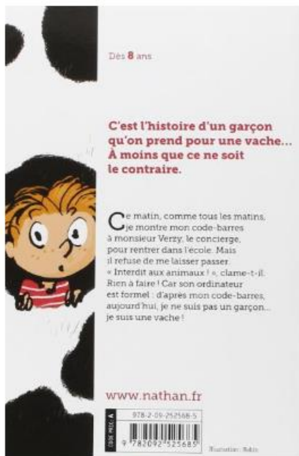
Quatrième de couverture

➔ Exercice 1 : Réalise la carte d'identité de ce livre. Certaines parties sont déjà remplies.